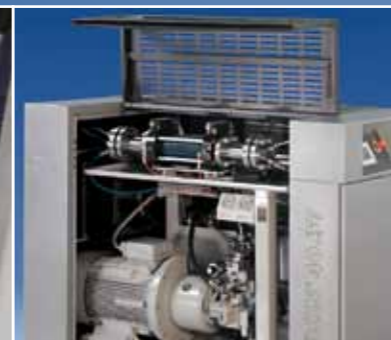
Gute Zugänglichkeit, einfache Wartung und Bedienung.