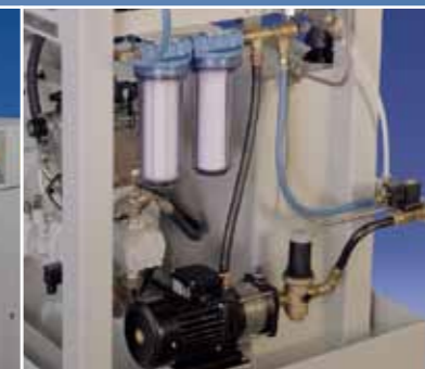
Optimale Speisewasserversorgung über Vordruckpumpe und Doppelfilter.