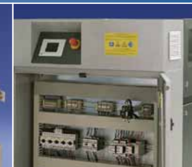
Schaltschrank mit Elektrokomponenten. Einfache Bedienung über Touch Screen.