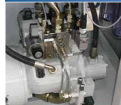
Robuste Antriebshydraulik mit Axialkolbenpumpe und separater Zahnradpumpe.

werden nach der Maschinenrichtlinie 98/37/EG und der Druckgeräterichtlinie 97/23/EG hergestellt. Die Konformitätserklärung ist ein Bestandteil der Dokumentation.